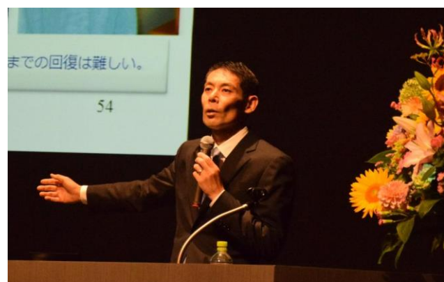
実体験をもとに、「言葉がけ」「あきらめないこと」の大切さが語られました。