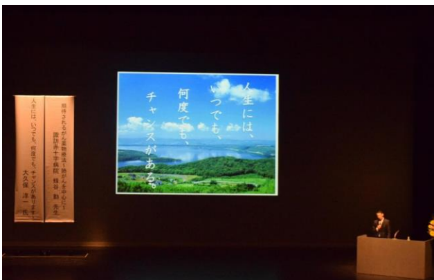
大久保先生には、たくさんの画像を使ってお話いただきました。