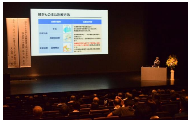
諏訪地域を中心に、県外からもたくさんの方にご来場いただきました。